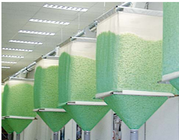
Lieferbar in 500 Liter-Säcken, geeignet für den Siloeinsatz.